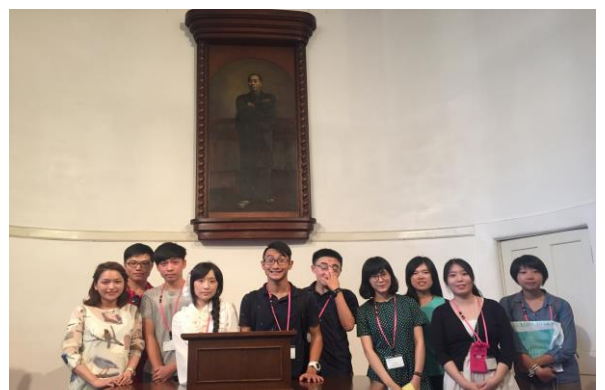
圖 4、與學校創辦人 福澤諭吉 教授合影