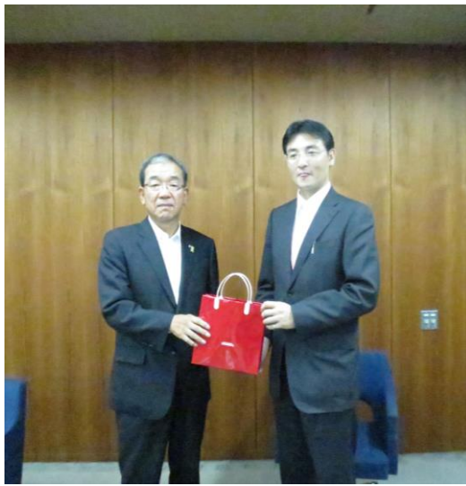
圖 6、本次參訪團團長(右)與廣島縣副知事(左)合影。