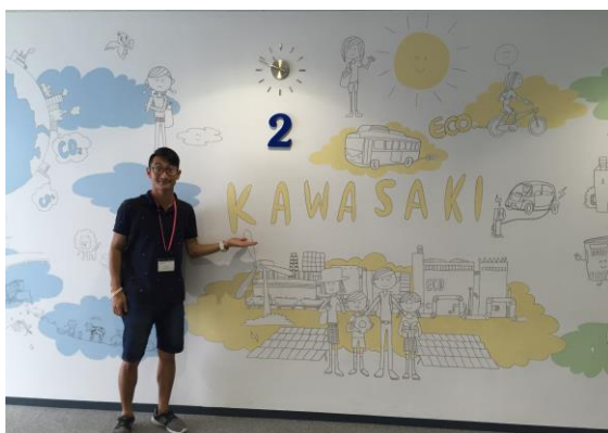
圖 3、川崎未來生活館示意牆

緊接著，我們來到與 早稻田 齊名的知名私立大學－慶應大學。我才知道原來這所學校的創辦人，竟然就是日幣一萬圓的封面人物－ 福澤諭吉 。所以在那兒的學生平常都會開玩笑的說：「你今天身上有帶老師出門嗎？」或是考試的時候帶著「老師」，感覺會有比較好的成績呢！在大學裡的食堂用完餐後，大家便前往聆聽由 清水 教授所帶來的精采演說。其中最令我印象最深刻的便是有關現在民主主義的濫觴，以及非一黨獨大或兩黨制的「聯合政府」所面臨的問題。接著，我們以政治、教育、文化，以及地方創生四個議題，與慶應大學的學生們面對面討論，交換彼此的看法，進而了解各自的文化差異。我們必須在短短的四十五分鐘內討論出其中一項議題的小結，並且上台做約莫五分鐘的報告。在這樣的時間壓力下，加上語言溝通上的困難，這實在是一項艱難的挑戰。但相對的，正因為時間的緊迫，在這短兵相接的面談當中，我們才更能聆聽到日本學生們的真實想法。否則，依照日本人一直以來的傳統民族性，他們也許會十分客氣、收斂自己的鋒芒，並且使用很多敬畏語，使得整段討論的效率備受打擊。