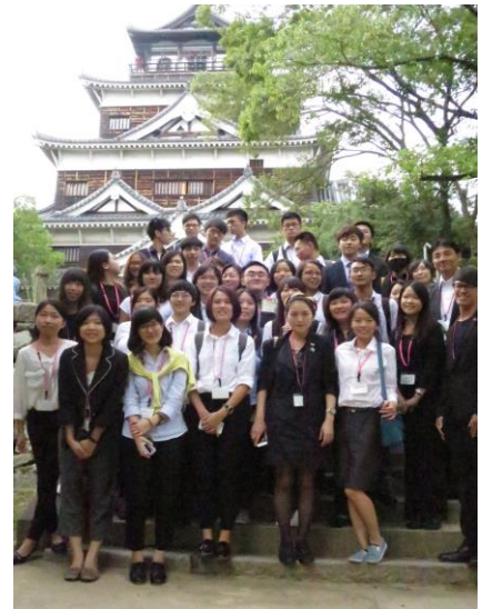
圖 7、團員們與廣島城 - 天守閣合影。